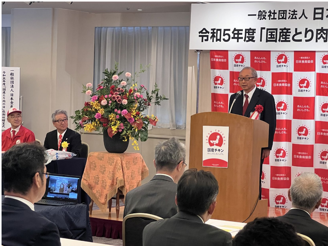
稲葉社長 謝辞、記念講演